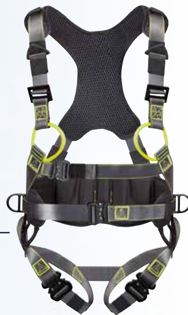
HAA35M S/M/L XL/XXL

Harnais bicolore avec ceinture de maintien. 2 points d'accrochage antichute (dorsal - sternal). 5 boucles de réglage, dont 3 boucles automatiques et 2 boucles indémontables. Ceinture de maintien avec dossier thermoformé. Rotation 120°. 2 points d'accrochage de maintien au travail (latéral). 1 point d'accrochage de retenue (arrière). Soft padding sur les épaules.