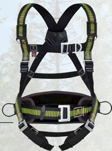
HAA24 S/M/L XL/XXL

Harnais bicolore avec ceinture de maintien. 2 points d'accrochage antichute (dorsal - sternal). 6 boucles de réglage. Ceinture de maintien avec dossier thermoformé. 2 points d'accrochage latéraux de maintien au travail.