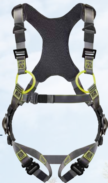
HAA32M S/M/L XL/XXL

Harnais bicolore. 2 points d'accrochage antichute (dorsal - sternal). 5 boucles de réglage, dont 3 boucles automatiques et 2 boucles indémontables. Soft padding sur les épaules et au niveau du bassin.