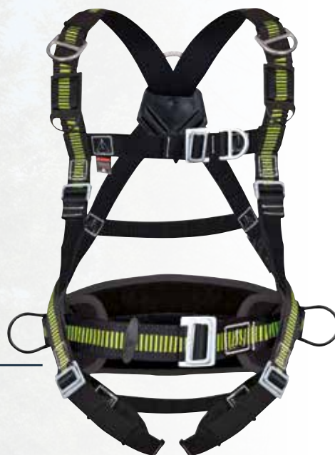
HAA26 S/M/L XL/XXL

Harnais bicolore pour sauvetage avec ceinture de maintien. 2 points d'accrochage antichute (dorsal - sternal). 6 boucles de réglage. Ceinture de maintien avec dossier thermoformé. 2 points d'accrochage latéraux de maintien au travail. 2 D-rings sur les épaules spécifiques pour sauvetage. 2 emplacements porte longe.