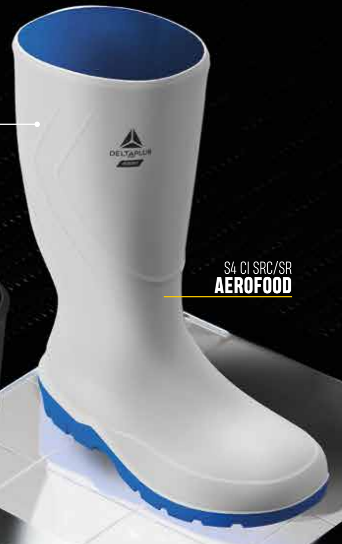
S4 CI SRC/SR AEROFOOD