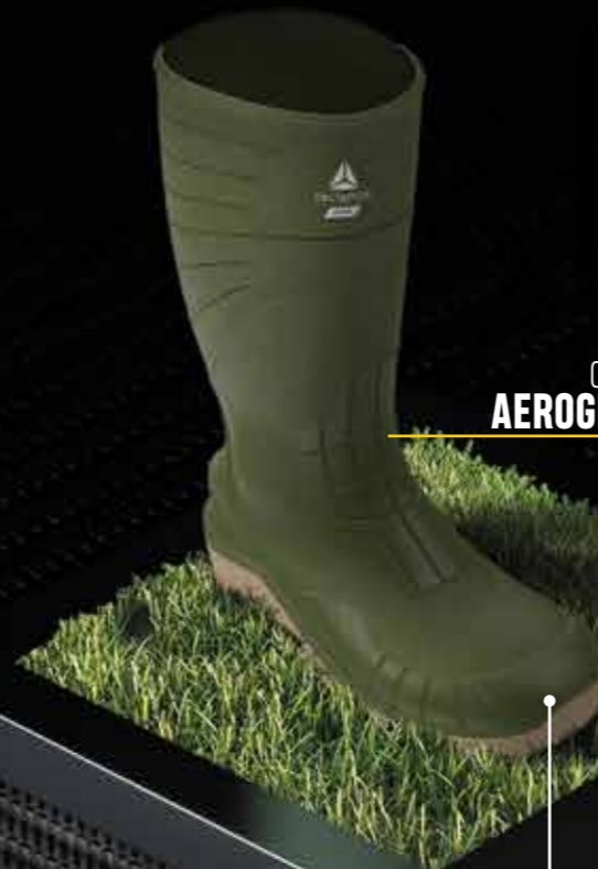
04 CI SR AEROGREEN