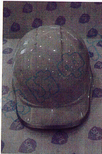
样 品 图 片